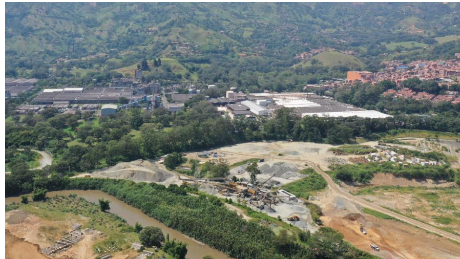
Industrial ConCreto, (Girardota, Antioquia, Colombia)