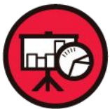
Monitoreo y Evaluación