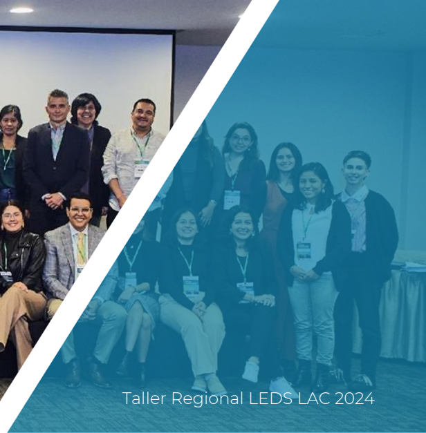
Taller Regional LEDs LAC 2024